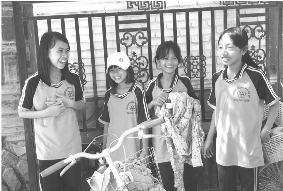
チャム人の村にて